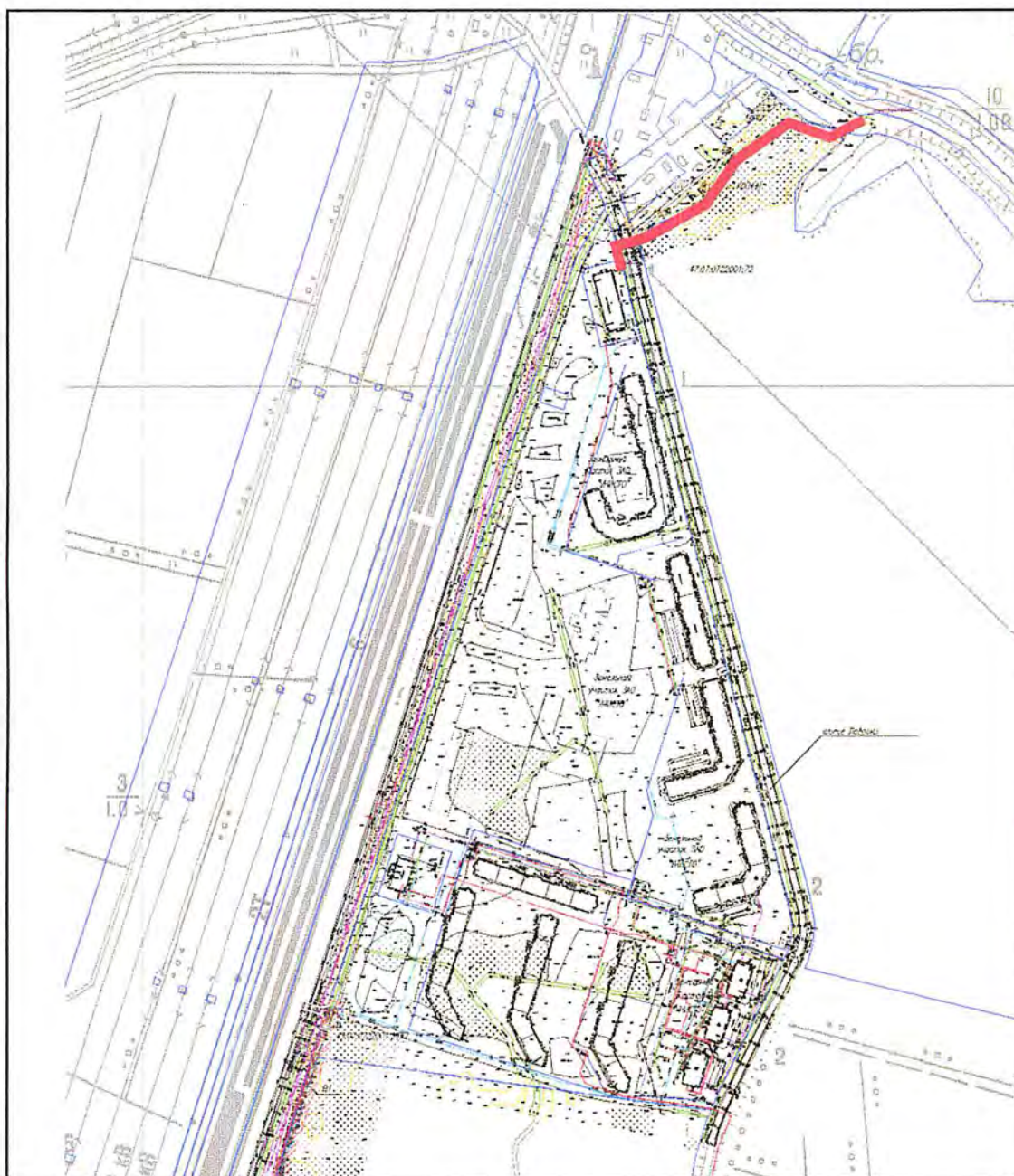
Схема границ проекта планировки и межевания территории линейного объекта «Наружные сети водоотведения. Коллектор М4 от канализационных очистных сооружений (КОС)», расположенного: начальный пункт – северо-восточный угол квартала жилой застройки – от площадки канализационных очистных сооружений (КОС) на земельном участке с кадастровым номером 47:07:0722001:632; конечный пункт – река Охта, ближайшая точка.