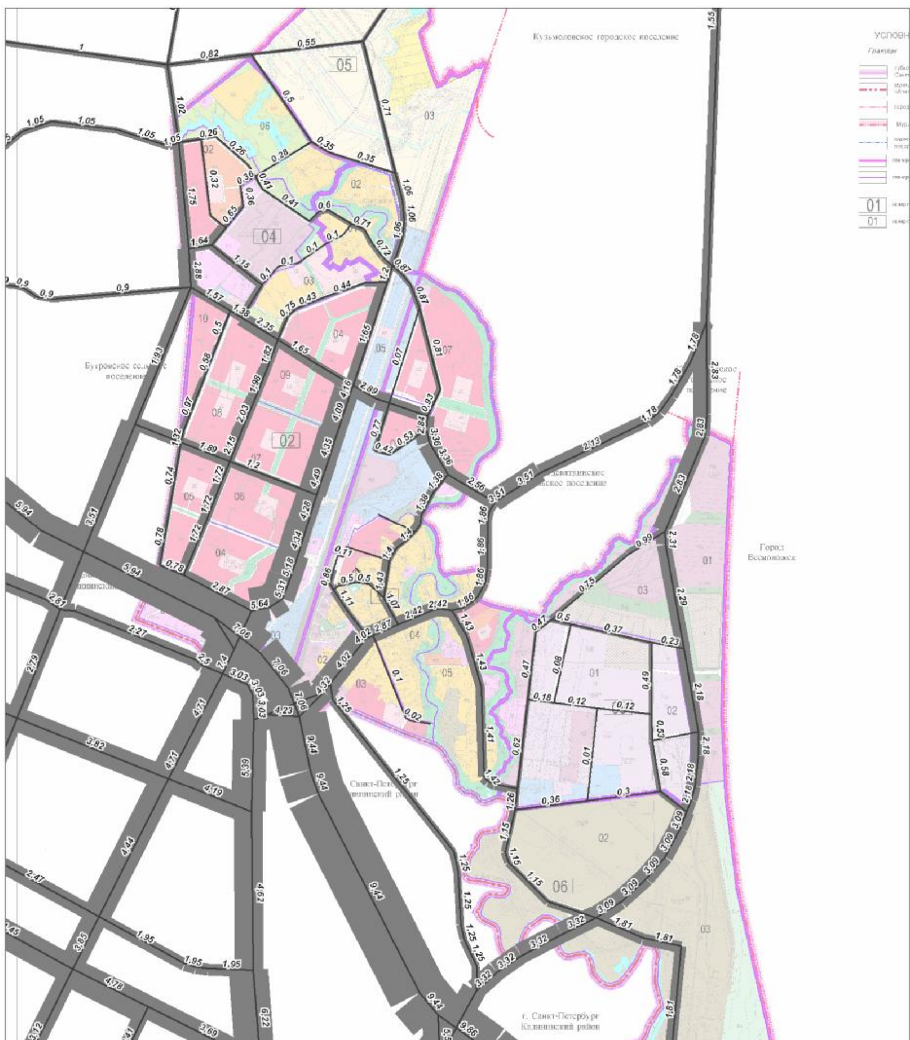
Схема 3. Картограмма автомобильных потоков, 2030 год (тыс.привед.ед. в утренний среднеразмерный час в обоих направлениях) включая потоки к станции метро «Девяткино»