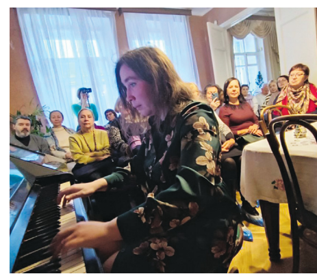
Прикоснуться к истокам через музыку