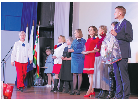
Ангелы тыла – сильные духом