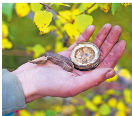
История одного компаса