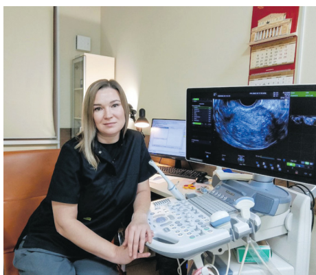
«Профессионализм, согретый человеческим теплом, – вот мой ориентир»