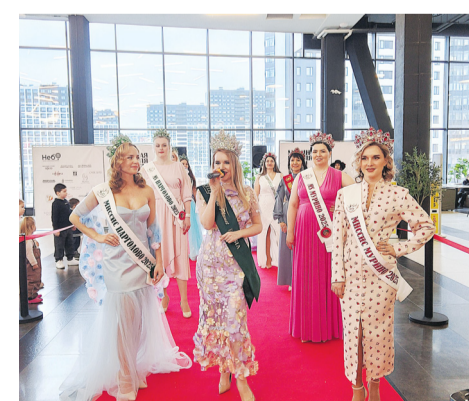
Праздник весны, красоты и стиля