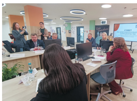
В единстве – наша сила