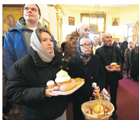
Пасхальная ночь и радость в сердцах