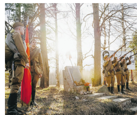
Мы еще вернемся