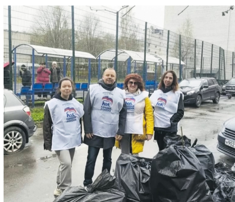
Наш город – это наш общий дом