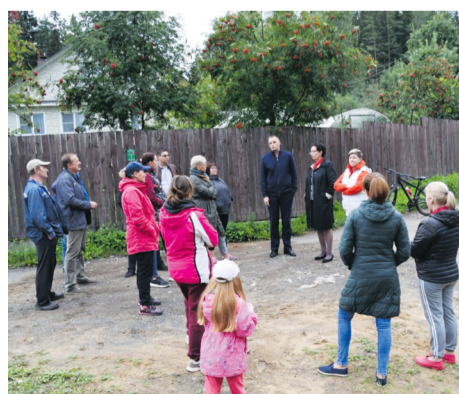
Депутат – это посредник, советник и поддержка