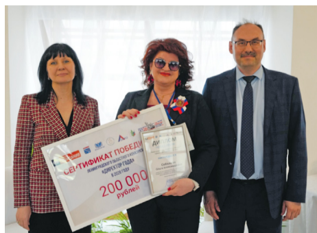
Вдохновлять и вести