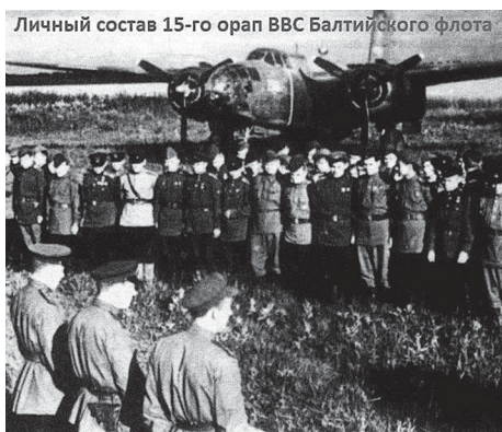
Вечно живые. История одной семьи