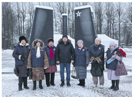
Цветы памяти на «Румболовской горе»