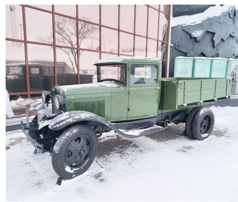
Память, застывшая в граните