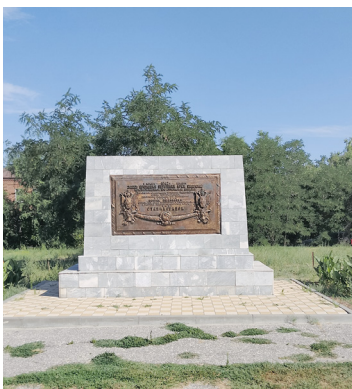
Несокрушимый «Остров Людникова»