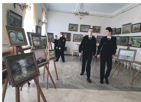
Порт-Артур. Незаслуженно забытая война