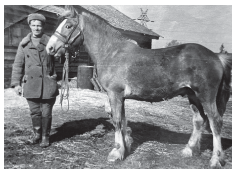
От немецкой слободы до современного города