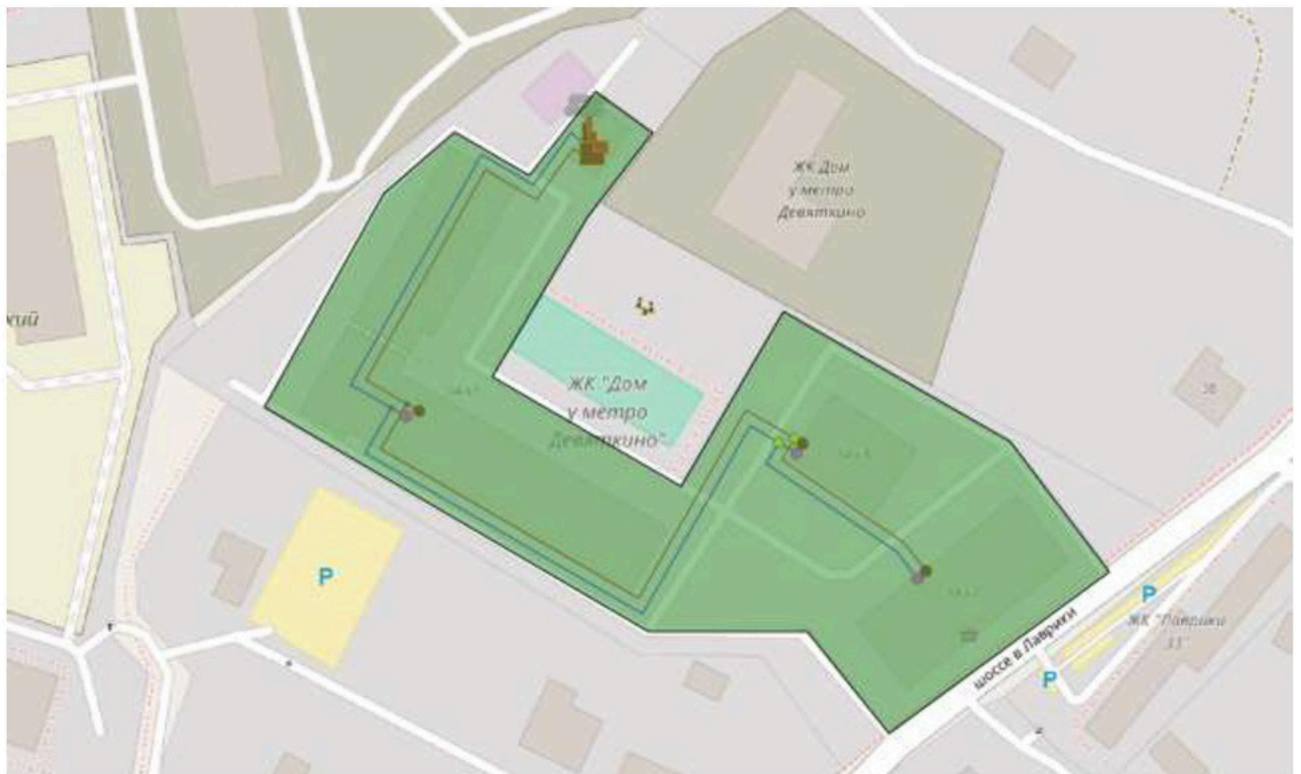
Рисунок 6. Зона действия БМК Лаврики д.34

Объектами теплоснабжения котельных являются как жилые дома, так и объекты социально-бытового назначения