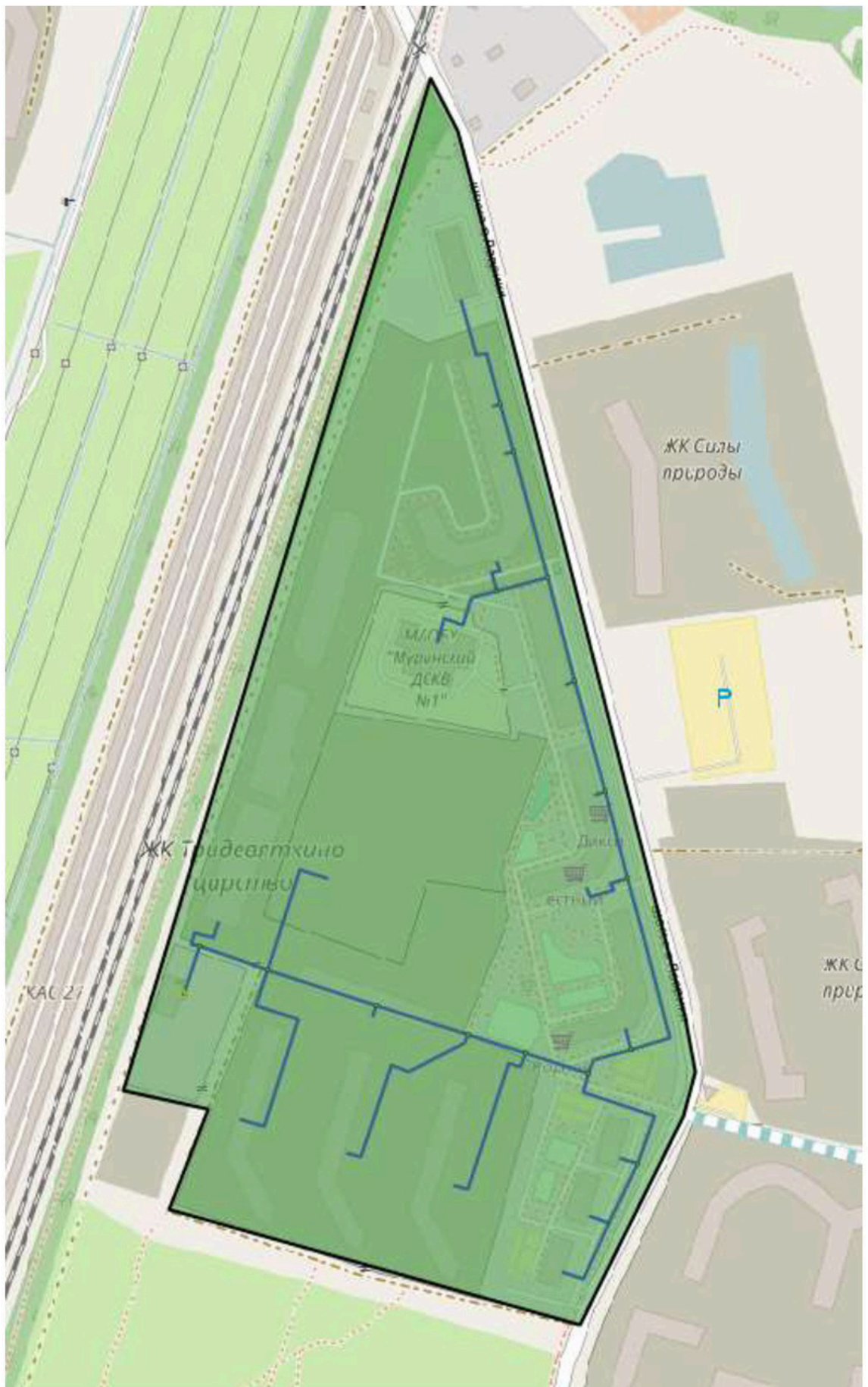
Рисунок 2. Зона действия котельной ООО «ЖилКомТеплоЭнерго»