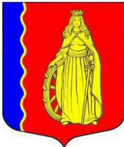
СХЕМА ТЕПЛОСНАБЖЕНИЯ МУНИЦИПАЛЬНОГО ОБРАЗОВАНИЯ МУРИНСКОГО СЕЛЬСКОГО ПОСЕЛЕНИЯ ВСЕВОЛОЖСКОГО РАЙОНА ЛЕНИНГРАДСКОЙ ОБЛАСТИ

УТВЕРЖДЕНО Постановлением главы администрации МО "Муринское сельское поселение" Всеволожского муниципального района Ленинградской области № 79 от 16.03.2018 г.