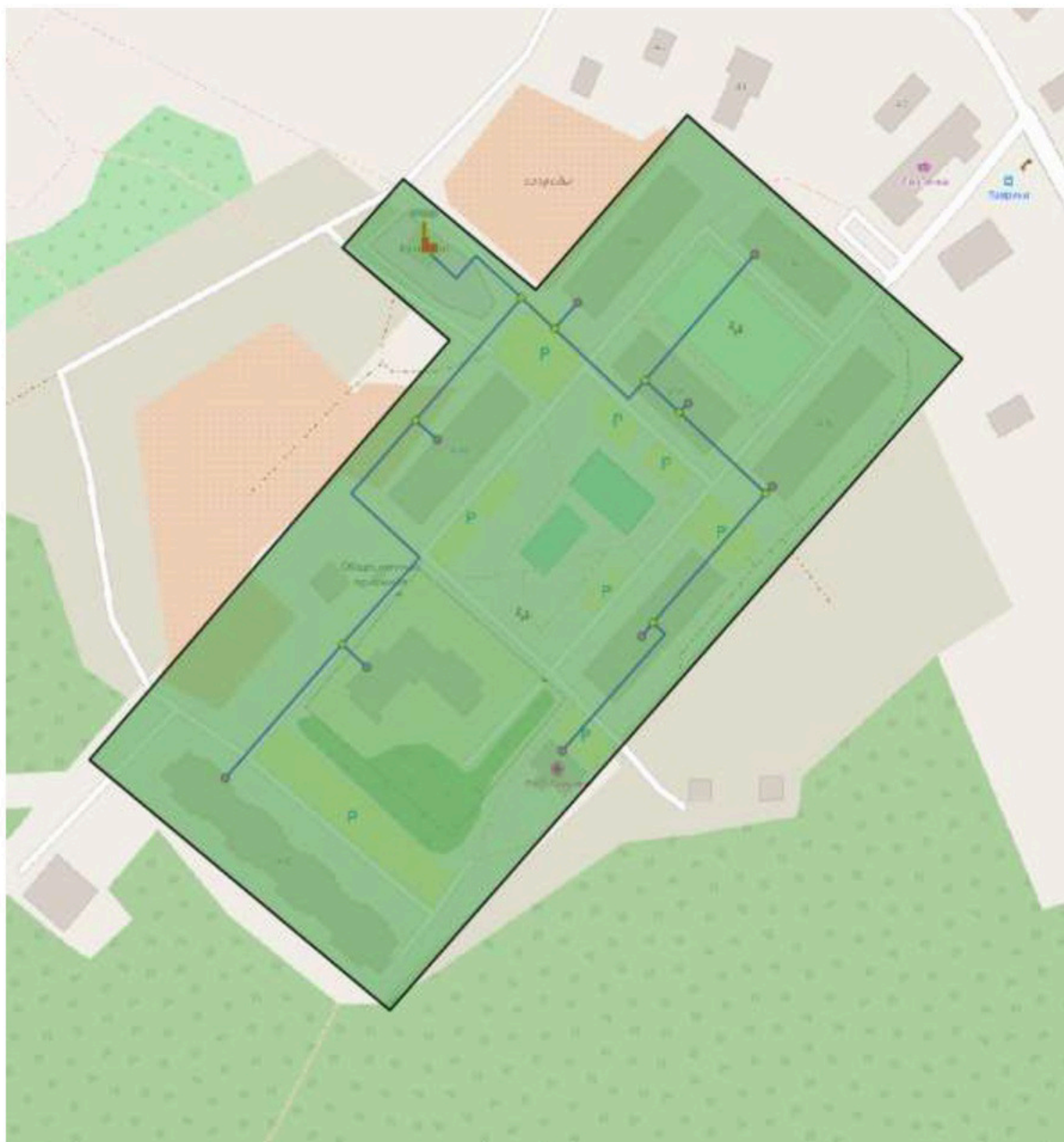
Рисунок 1. Зона действия котельной ООО «ПРОДЭКС-ЭНЕРГОСЕРВИС»

Расположение централизованных источников теплоснабжения с выделением зон действия приведено на рисунках ниже.