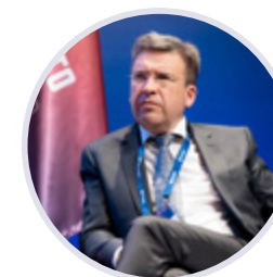
Владлен Максимов Президент Ассоциации малоформатной торговли России